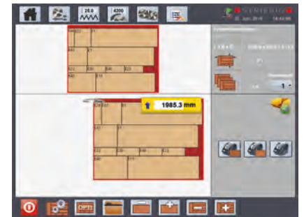
Procesamiento del plan de corte BaseCut